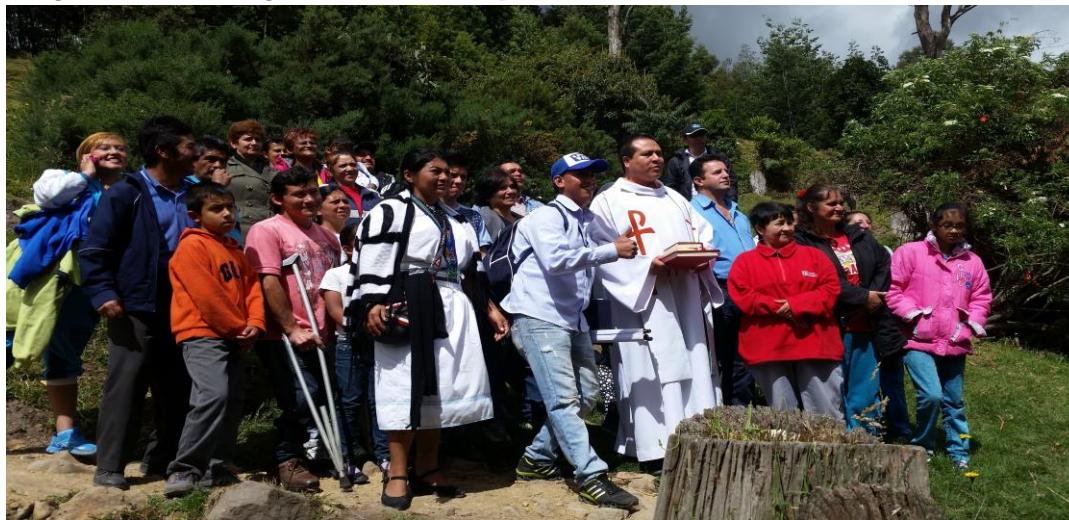
Imagen N° 1: Entrega simbólica de quebradas, Bolonia, octubre 2015

Así, por ejemplo, en Nuevo Usme adquirió especial relevancia gestionar alternativas frente al déficit de cupos educativos, mientras que en Bolonia ha sido significativo el peso que ha tenido la apropiación del espacio público conformado por las áreas de manejo y protección de las quebradas Bolonia y Santa Librada, que surcan el microterritorio.