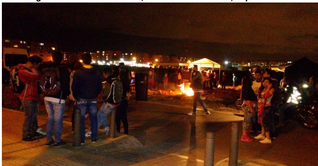
Imagen N° 2: Noche sin Miedo, Porvenir - Villa Karen, Septiembre 2015