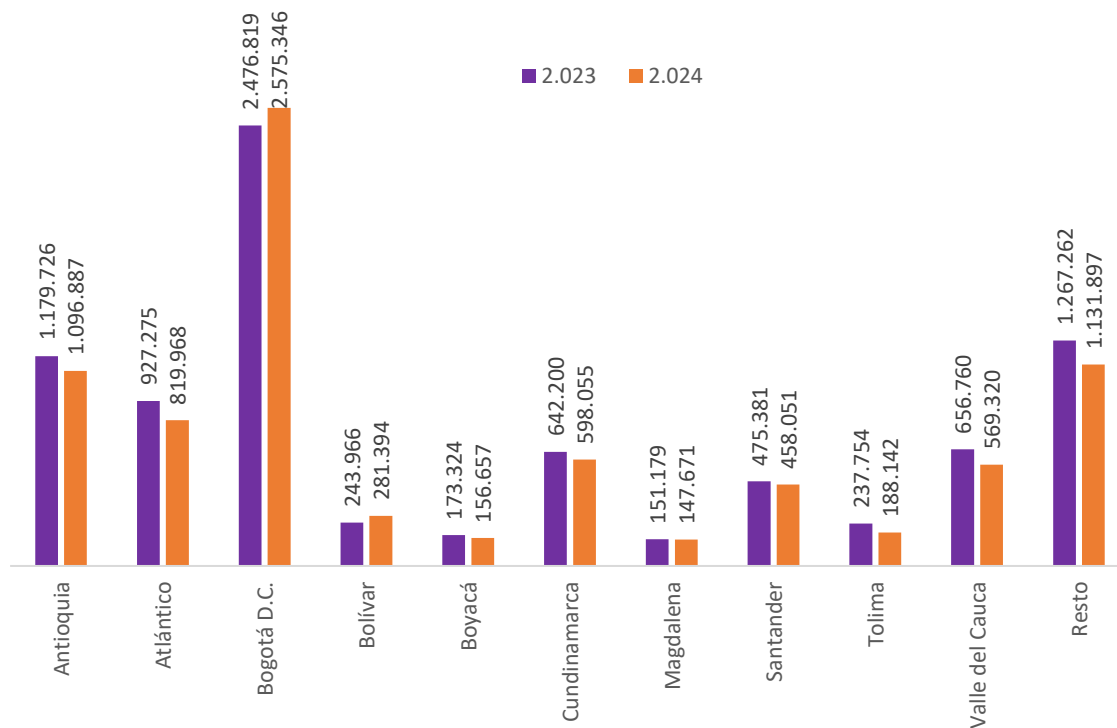
Gráfico 3. Producción de concreto premezclado en metros cúbicos por departamento (doce meses, 2023 Vs 2024)